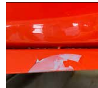
plastique - pas d'adhésion métal promoteur requis