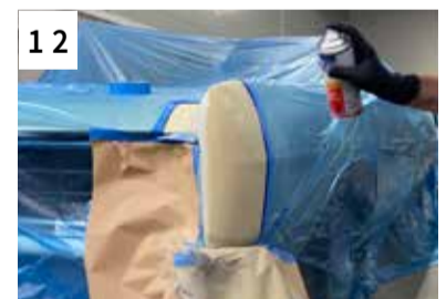
12 Originalfarbton applizieren (je nach Deckkraft 2-3 dünne Spritzgänge)