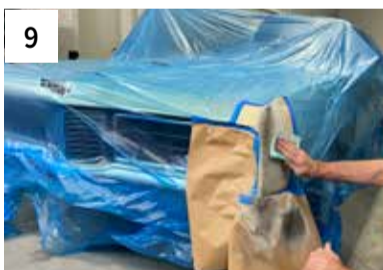
9 Manuell schleifen P600