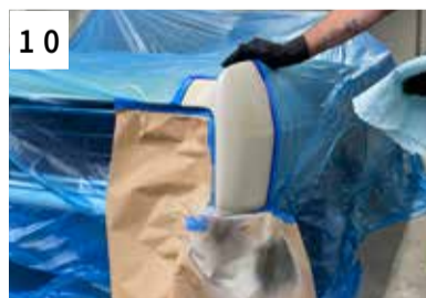
10 Prüfen auf Porenfreiheit