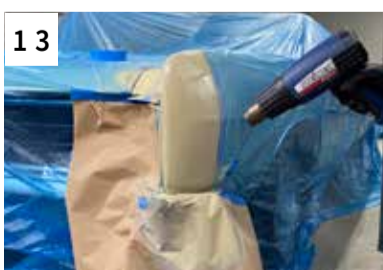
13 Ablüftzeit zwischen den Spritzgängen 3-5 Min.