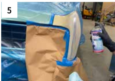
5 Reinigen mit 1K Silikonferner