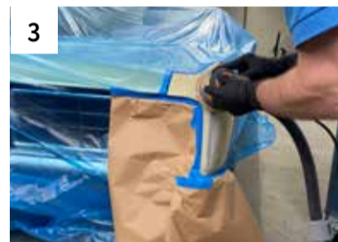
3 Fahrzeug abdecken / Schadstelle mit Maschine schleifen P320/P400