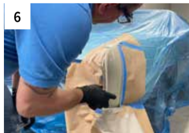
6 Grundieren mit 2K Epoxy Grundierfüller