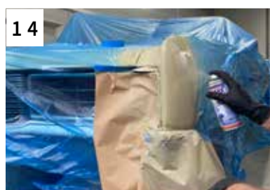
14 Klarlack applizieren (1 dünnen Klebegang und 2. satten Spritzgang)