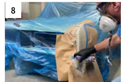
8 Check mit 1K Kontrollschwarz