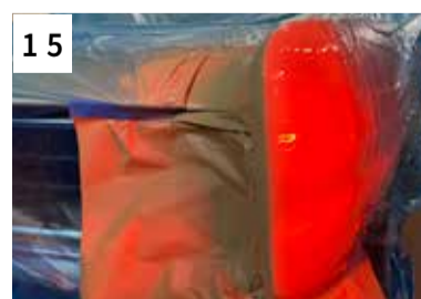
15 IR Trocknung ca. 30 Min.