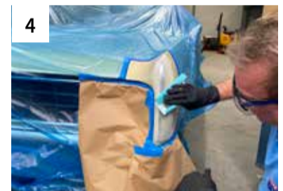
4 Randzone manuell schleifen mit P600