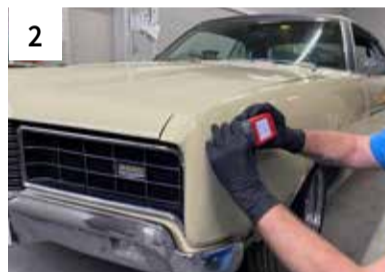
2 Farbton Ermittlung