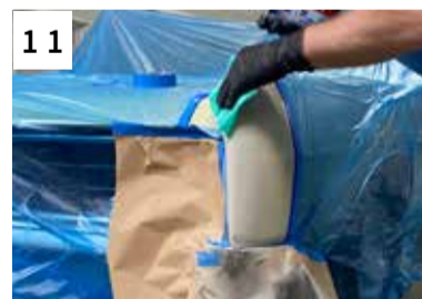
11 Reinigen mit Silikonferner + Staubbindetuch