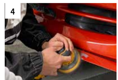
4 Randzone schleifen maschinell P320 bis