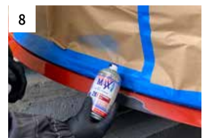
8 Grundieren mit 2K Rapid-Grundierfüller (2-3 Spritzgänge)