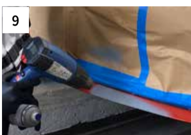
9 Ablüften (ca. 5 Min zwischen den Spritzgängen)