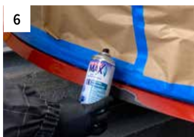
6 Vorbereiten mit Kunststoff-Haftvermittler (1 dünne Schicht)