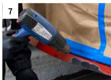
7 Schadstelle ablüften (Lufttrocknung oder forciert)