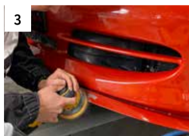
3 Schadstelle schleifen maschinell P80 bis 240