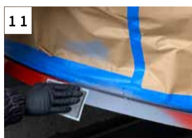
11 Schleifen mit P400 bis P600 Randzone mit P1000