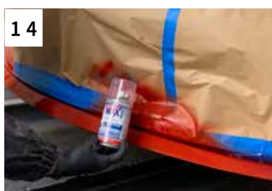
14 2K Rapid-Klarlack applizieren (2 Spritzgänge mit