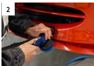
2 Schadstelle großzügig polieren