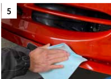
5 Reinigen mit 1K Silikonentferner