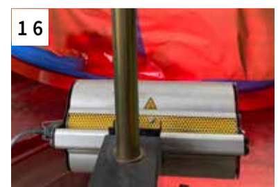
16 IR Trocknung ca. 15 Min.