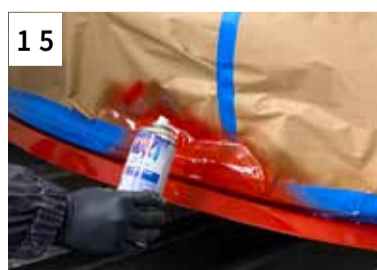
15 Auf Randzone Beispritzlack dünn applizieren