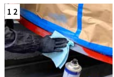
12 Reinigen mit Silikonentferner und Staubbindetuch